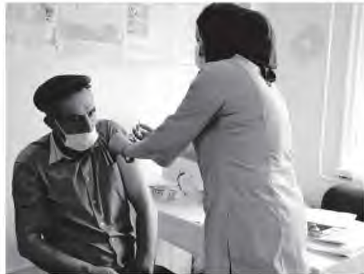
Суратрай: вакциналуу хьанай душиву. ххаллаххив буллая.

най дур вакциналуу ххалаххив буллалаву. Махьсса члу малнин районналий вакциналуу ххалаххив бусса хьанай бур ряххттуршлий му кьцалуннир ливчусса инсантал. Гьай-гьай, ацния ца азарунния ливчусса инсантал бусса районналий инсантурах бурувгунми уттигу чанни. Гьарца инсаннал цал уттигу бувчлин аьркинни цайнма вакциналуу ххалаххи буван баву-му хьхьич-ва-хьхьич цала, яла мачча-гьанминнал, лагма-ялттуминнал цулуу-сагьшиву дуруччаву