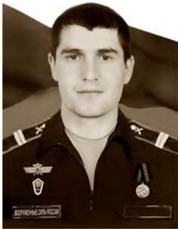
агьалинал дакIурдиву ва мукуна жу зул хIукумулул

вирттал оьрмулуцIа буллалли шиву.Цила оьрмулий хIайп кьаувкун Аликлул ашкара дунни цила хIучI кьауцайсса хасият ва оьрмулул ахир хьуннин талай ивкIунни цила гьалмахталгу эьки кьакъаб ивтун.Му хьунни цил багъайкунсса виричу жула Ххувшаврил цIанийсса ххулий. Мунал аьпа абадлий личIантIиссар районналул