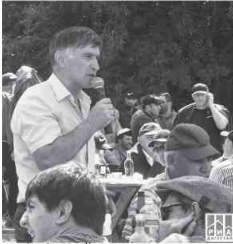
зорну (та чІумалсса Орджоникидзеул муххал ххул СумбатІичу Рамазан

.Хьиннува миннаву дуккав риву ва давриву хьхьичІун ливчуми хьанай бивкІссар хьуними инженерталну, станциярдал ва дистанцияр дал, вокзаллал, отделлал ва щалагу МахІачкалаллал отделенялул начальник талну.Цалчинсса ларайсса дипломращалсса муххал ххуллул кІулушиву ларьсса пишакарну,бусласаврийн бувну ккаллину ур-Садык Умаров, цувгу путейцынал ученикная тІайла хьуну гьаз хьусса муххал ххуллул генеральнойн иянинн ва 40-50 ку шиннарди му зий ивкІссар Северо-Кавказуллал муххал ххуллул хьунама контролёр-реви-