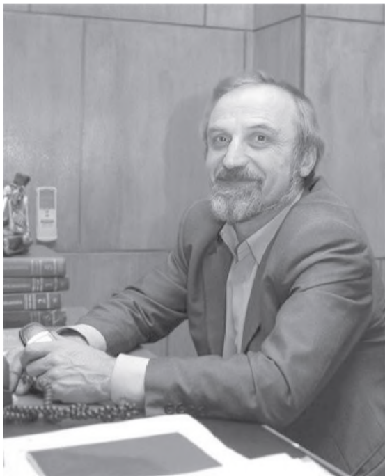
А м м а лавмартесса къачагьтурал