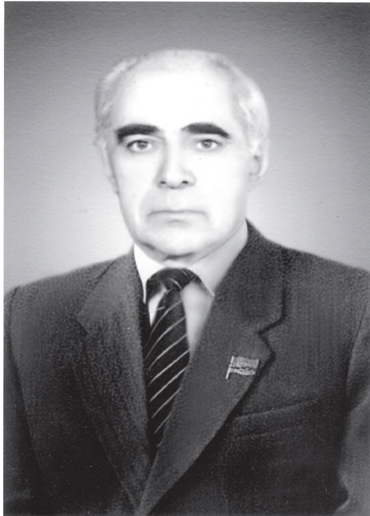
лалал ва Веденнал район найн (Чачан-Ингушнаву) бакъа Дагъусттаннал зунтта вунгу бичлай бивк1ессар Къах1ибуллал (ц1анасса

Му талатаву хъиннура къызгъин дулай дирк1ун дур дазул къат1ув хъанахъими иширттал. 1930-ку шиннар